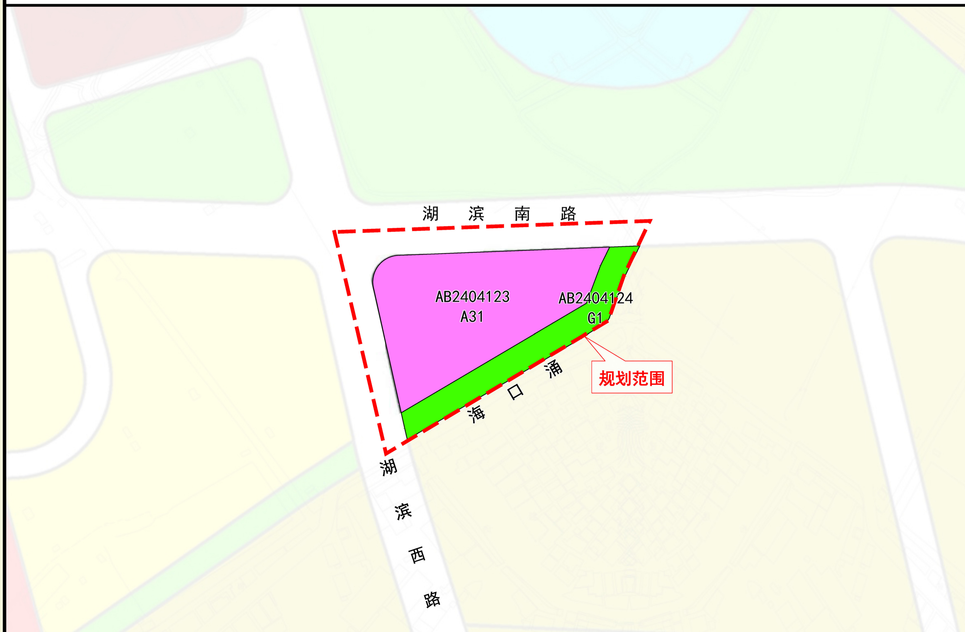
调整后规划示意图